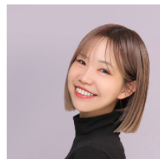
henum producer #péil nail owner erina先生